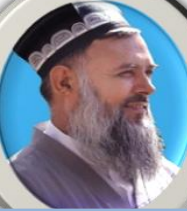
سید عبدالله نوری